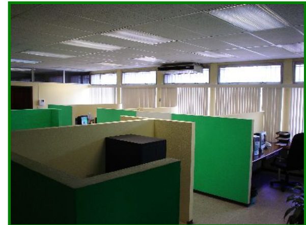
Instalaciones de oficinas del ERSAPS

El Directorio del Ente Regulador, trabaja en su ordenamiento administrativo y como parte de esa labor, formuló y aprobó su “Reglamento de Viáticos y Gastos de Viaje” con base en las disposiciones existentes para órganos del Poder Ejecutivo, y también aprobó el “Manual de Procedimiento Administrativo del Ente Regulador” como herramienta interna para Expedientes y Procesos Ordinarios de su función como órgano contralor para la prestación de Servicios de Agua Potable y Saneamiento.