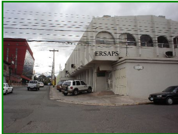
Vista edificio oficinas del ERSAPS

En el mes de Julio de 2005 se dispuso de las nuevas instalaciones de la oficina del E R S A P S en el Edificio Roma, No. 1601, Colonia Palmira, Tegucigalpa, siendo debidamente acondicionado y equipado con las facilidades indispensables de oficina.