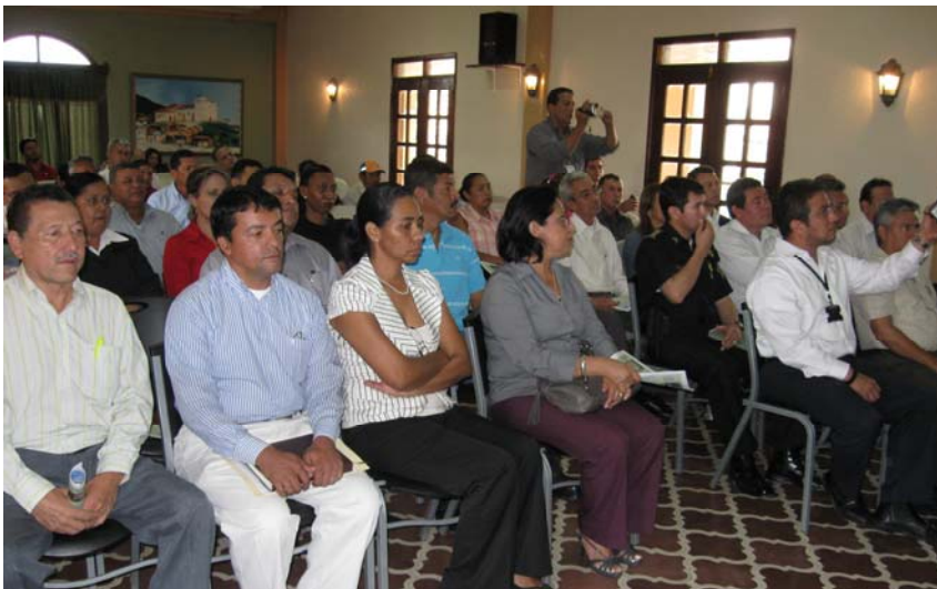
Vista parcial de los asistentes al acto oficial de traspaso del acueducto.

El SANAA entregó uno de sus mejores sistemas del país, que es auto suficiente, a lo anterior hay que sumarle que la ciudad de Comayagua tiene un potencial hídrico que le garantiza el suministro del vital líquido a las personas.