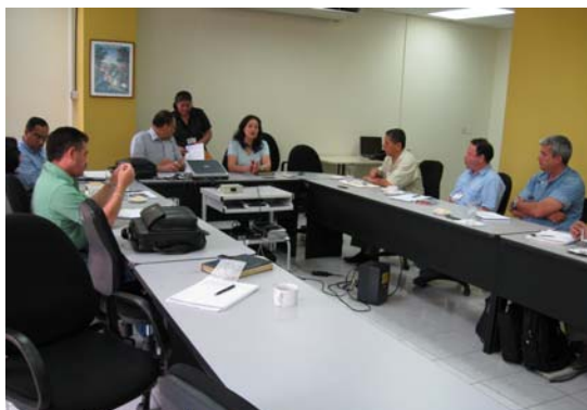
CAT`s de PROMOSAS, reunidos en Tegucigalpa.

Con el fin de monitorear el cumplimiento de las actividades orientadas al apoyo de las municipalidades a través de los Consultores de Apoyo Técnico (CAT`s) de primer y segundo nivel, se realizó una reunión de trabajo en las oficinas del PROMOSAS, en la Secretaría de Finanzas.