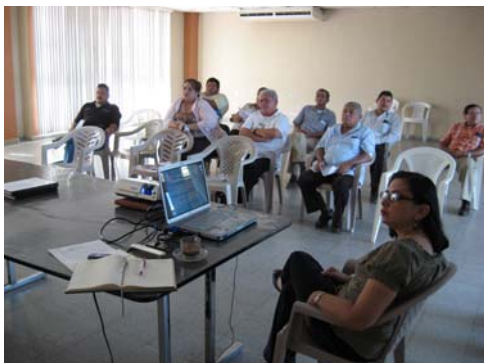
Taller de información y socialización en la municipalidad de La Lima.