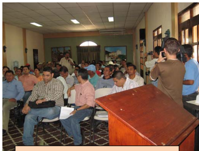
Cabildo abierto para elegir la COMAS y USCL en Comayagua.

Esta asamblea estuvo precedida de una intensa labor informativa y de socialización, efectuada por técnicos del PROMOSAS, ERSAPS y la Municipalidad, a través de los distintos medios de comunicación local. Así como de una serie de encuentros, con diversos sectores sociales del municipio, con los que se dialogó sobre los alcances del proceso de municipalización del agua.