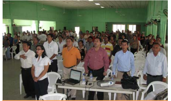
Elevada participación ciudadana en el cabildo abierto efectuado en Choloma.

Asistieron a las mismas representantes de 13 juntas de agua, de COPECO, varios patronatos comunales, CONVIDA, candidatos a alcaldes, la Oficina Municipal de la Mujer, Ordenamiento Territorial, Comisión de Transparencia, personal DIMACH, ODEF Choloma, Regidores Municipales y Bomberos.