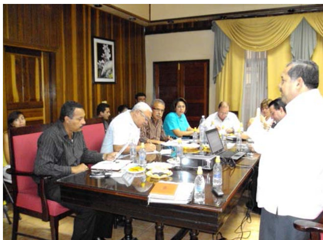
Reunión de la Corporación Municipal en la que se firmó el convenio de participación.

Otro de los objetivos son el implementar el Sistema de Información Sectorial y atención de solicitudes dentro de la USCL, establecer las ordenanzas municipales para aplicar los Reglamentos de Tarifas, Servicios y Atención de Solicitudes y Reclamos, aprobar el Modelo de Gestión y organización del prestador de servicios, revisar y dictaminar sobre el Plan Maestro en ejecución financiado por PROMOSAS y crear las condiciones para que la Municipalidad propicie la aplicación del Reglamento de Calidad del Servicio y Contrato de Prestación.