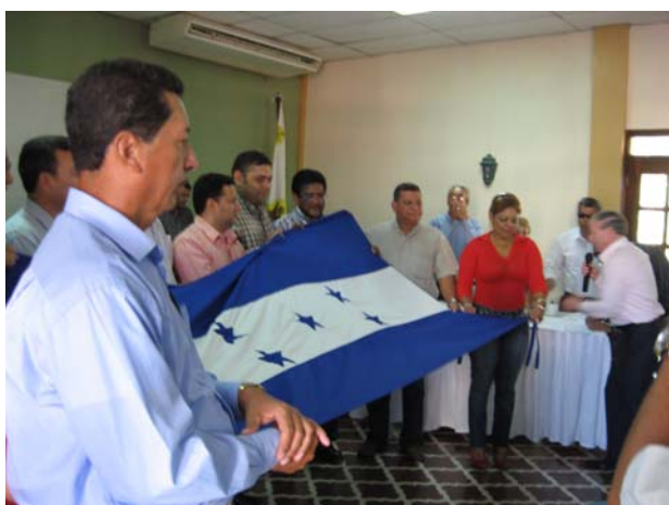
El Alcalde Municipal juramentó a los miembros del COMAS de Comayagua.

Destacó Miranda que la municipalización del agua de Comayagua es una forma de devolverle al municipio su soberanía, ya que los recursos naturales le pertenecen y por tanto deben ser manejado por éste.