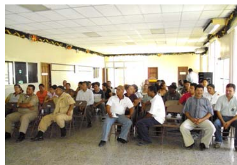
Asamblea ciudadana en Puerto Cortes.

El día 23 de abril se realizó la primera asamblea informativa con miembros de la sociedad civil de Puerto Cortes, con el propósito de socializar la Ley Marco del Sector Agua Potable, exponer las funciones del ERSAPS y dar a conocer el proyecto PROMOSAS.