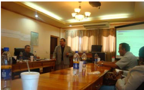
Asistentes al taller de validación.

Posteriormente se realizó un taller, con representantes de las municipalidades participantes en el PROMOSAS, para validar el manual de buenas prácticas ambientales. Al evento asistieron contratistas, consultores privados y representantes de las Unidades Municipales Ambientales. Los asistentes se comprometieron a enviar posteriormente sus observaciones.