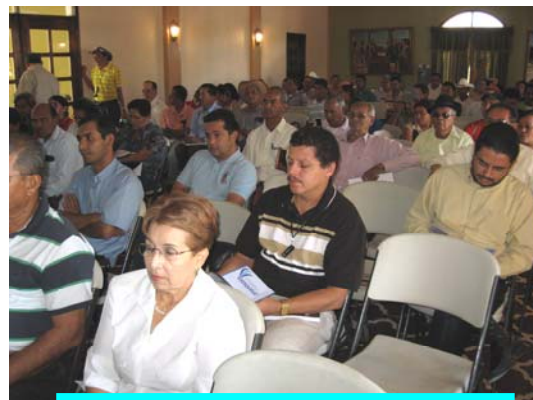
Parte de los asistentes a la asamblea en Comayagua.