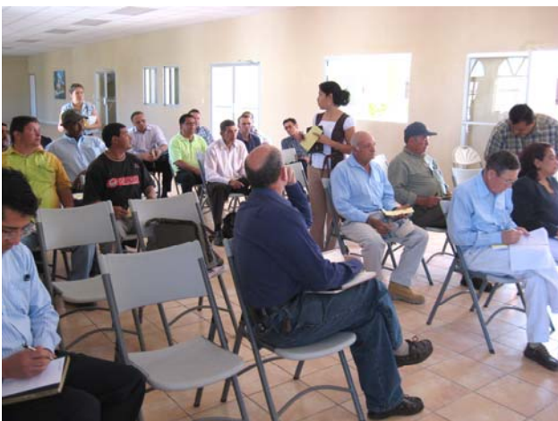
Representantes de distintas organizaciones y sectores sociales de la ciudad participaron en el taller de Danlí.

Al finalizar los estudios de los Planes Maestros los mismos estarán disponibles a todos los interesados en las Páginas Web del PROMOSAS, ERSAPS y SANAA.