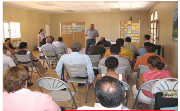
Taller diagnóstico en el municipio de Danlí.

En dichos encuentros participan distintas personas de los municipios, conocedores del tema de agua potable y saneamiento, ellos mediante una metodología participativa elaboran una radiografía de la situación que viven sus comunidades.