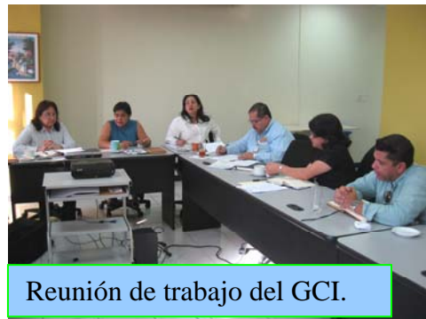
Reunión de trabajo del GCI.